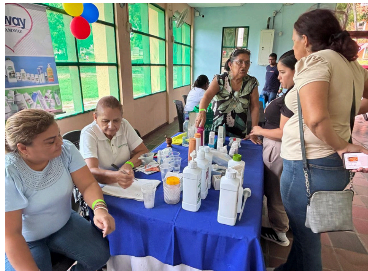
Sabanaton y Feria de Emprendimiento CAMPAMENTO CASA GRANDE